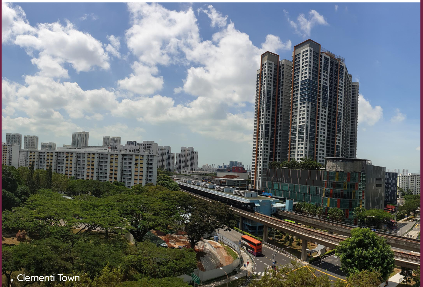
• Clementi Town

我们的规划确保每个市镇有宜居的居住环境并且自给自足，无论商店、医疗设施、学校、社区设施和公园都由有效的交通网络联系起来使居民可以方便使用。此外，市镇内或其周边的商业中心、工业区和商业园也能为居民提供就近就业机会。每个市镇的详细规划与规划的落实都是多个政府机构共同努力的成果。