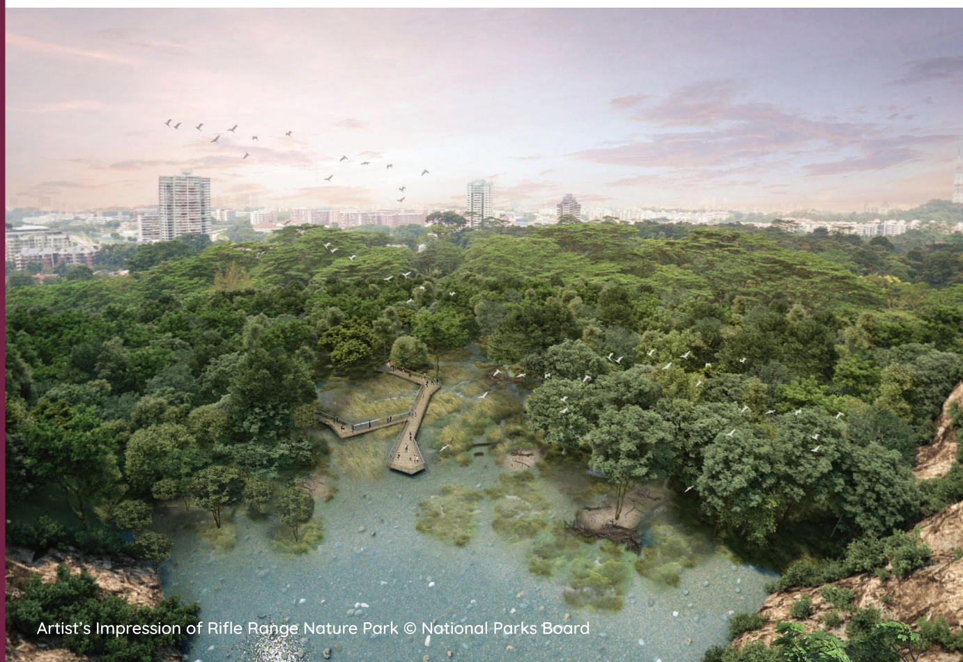
Artist's Impression of Rifle Range Nature Park

Our towns are planned to be liveable and self-sufficient, with easily accessible shops, health care, schools, community facilities and parks. Commercial nodes, industrial estates and business parks within or nearby the town, also help to provide nearer job opportunities for residents. The detailed planning and implementation of plans for each town is a joint effort of many government agencies.