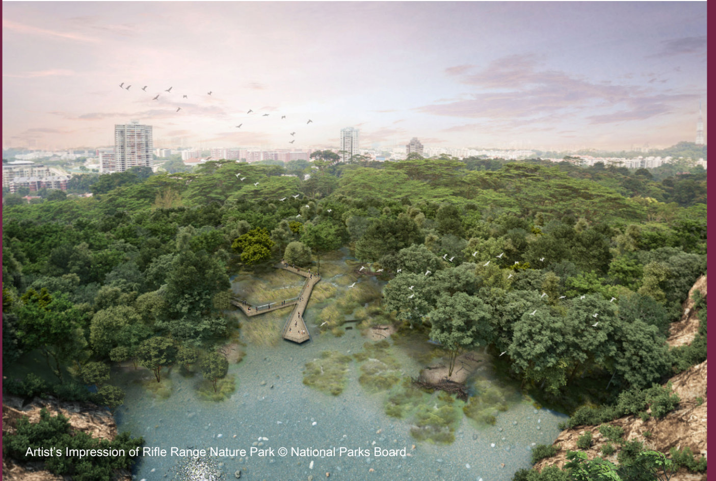
Artist's Impression of Rifle Range Nature Park

நமது நகரங்கள், வாழத் தகுந்த வகையில், எளிதில் சென்றடையக்கூடிய கடைகள், சுகாதாரப் பராமரிப்பு சேவைகள், பள்ளிகள், சமூக வசதிகள், பூங்காக்கள் ஆகியவற்றுடன் கூடிய போதுமானத் தன்மையுடன் இருக்கும் வகையில் திட்டமிடப்படுகின்றன. நகரத்திற்குள் அல்லது நகரத்திற்கு அருகே அமைக்கப்பெறும் வர்த்தக முனைகள், தொழில்துறைப் பேட்டைகள் மற்றும் வர்த்தகப் பேட்டைகள், குடியிருப்பாளர்களுக்கு மிக அருகாமையிலேயே வேலை வாய்ப்புகளை அளிக்கத் துணை புரிகின்றன. ஒவ்வொரு நகரத்திற்கான விரிவான திட்டமைப்பும் அவற்றின் செயலாக்கமும், பல அரசாங்க அமைப்புகளின் கூட்டு முயற்சியாகும்.