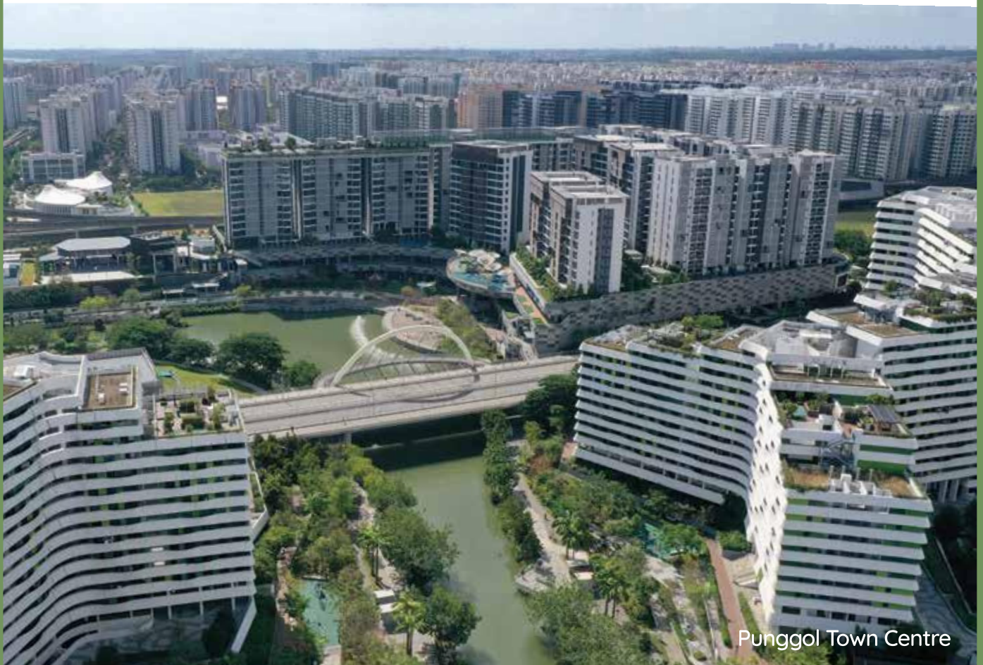
Punggol Town Centre

我们的规划确保每个市镇有宜居的居住环境并且自给自足，无论商店、医疗设施、学校、社区设施和公园都由有效的交通网络联系起来使居民可以方便使用。此外，市镇内或其周边的商业中心、工业区和商业园也能为居民提供就近就业机会。每个市镇的详细规划与规划的落实都是多个政府机构共同努力的成果。