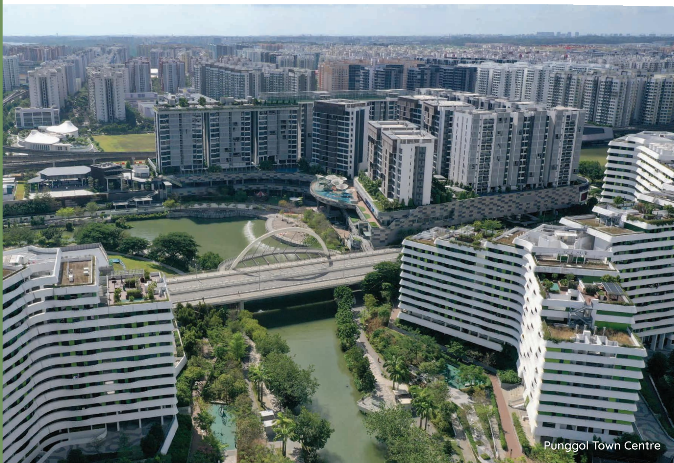
Punggol Town Centre

Bandar-bandar kita dirancang agar lengkap dan sesuai untuk didiami, dengan kemudahan kedai, pusat kesihatan, sekolah, prasarana masyarakat dan taman. Pusat-pusat komersial, estet-estet perindustrian dan taman-taman perniagaan di dalam lingkungan atau berhampiran kawasan bandar juga menyediakan peluang pekerjaan untuk penduduk setempat. Perancangan terperinci dan pelaksanaan pelan untuk setiap bandar merupakan satu usaha bersama pelbagai agensi pemerintah.