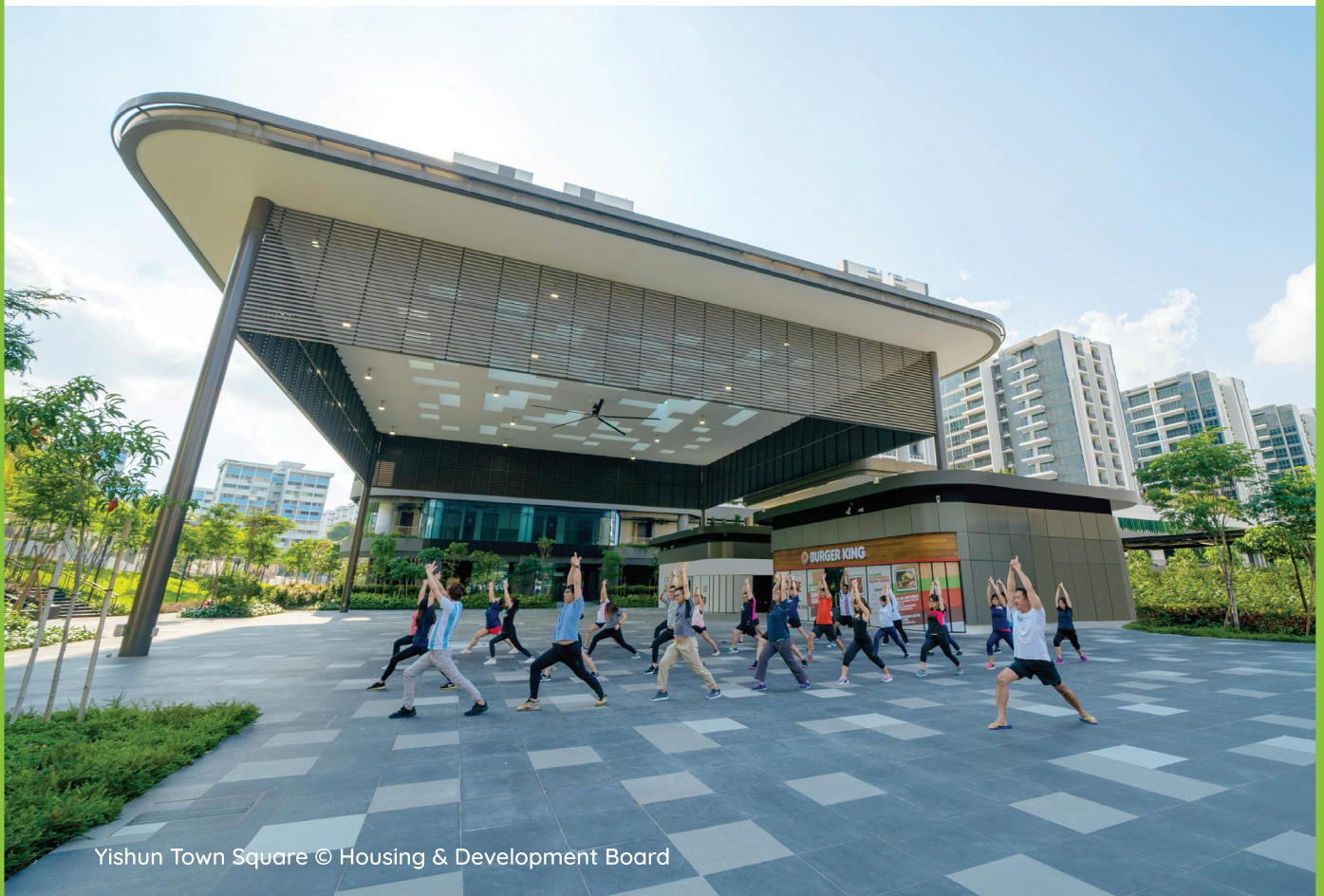
Yishun Town Square

Our towns are planned to be liveable and self-sufficient, with easily accessible shops, health care, schools, community facilities and parks. Commercial nodes, industrial estates and business parks within or nearby the town, also help to provide nearer job opportunities for residents. The detailed planning and implementation of plans for each town is a joint effort of many government agencies.