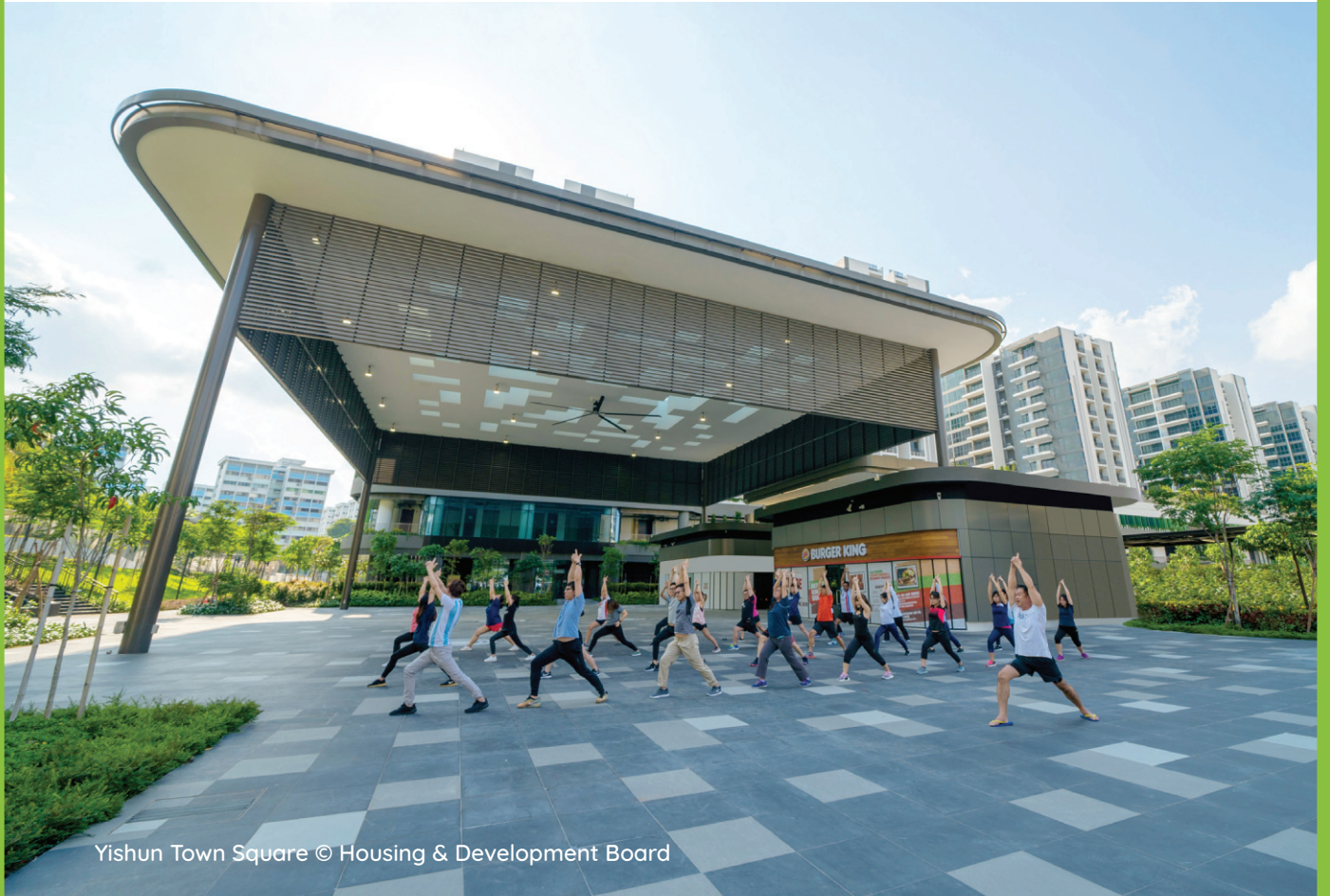
Yishun Town Square

நமது நகரங்கள், வாழத் தகுந்த வகையில், எளிதில் சென்றடையக்கூடிய கடைகள், சுகாதாரப் பராமரிப்பு சேவைகள், பள்ளிகள், சமூக வசதிகள், பூங்காக்கள் ஆகியவற்றுடன் கூடிய போதுமானத் தன்மையுடன் இருக்கும் வகையில் திட்டமிடப்படுகின்றன. நகரத்திற்குள் அல்லது நகரத்திற்கு அருகே அமைக்கப்பெறும் வர்த்தக முனைகள், தொழில்துறைப் பேட்டைகள் மற்றும் வர்த்தகப் பேட்டைகள், குடியிருப்பாளர்களுக்கு மிக அருகாமையிலேயே வேலை வாய்ப்புகளை அளிக்கத் துணை புரிகின்றன. ஒவ்வொரு நகரத்திற்கான விரிவான திட்டமைப்பும் அவற்றின் செயலாக்கமும், பல அரசாங்க அமைப்புகளின் கூட்டு முயற்சியாகும்.