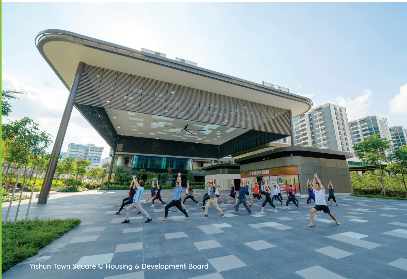
Yishun Town Square

Bandar-bandar kita dirancang agar lengkap dan sesuai untuk didiami, dengan kemudahan kedai, pusat kesihatan, sekolah, prasarana masyarakat dan taman. Pusat-pusat komersial, estet-estet perindustrian dan taman-taman perniagaan di dalam lingkungan atau berhampiran kawasan bandar juga menyediakan peluang pekerjaan untuk penduduk setempat. Perancangan terperinci dan pelaksanaan pelan untuk setiap bandar merupakan satu usaha bersama pelbagai agensi pemerintah.