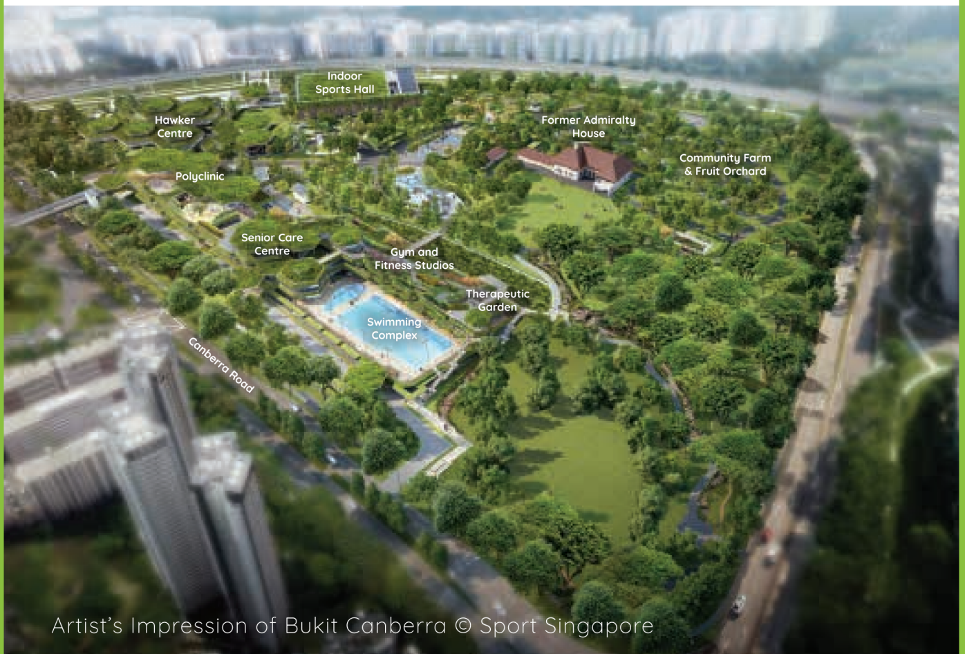
Artist's Impression of Bukit Canberra

我们的规划确保每个市镇有宜居的居住环境并且自给自足, 无论商店、医疗设施、学校、社区设施和公园都由有效的交通网络联系起来使居民可以方便使用。此外, 市镇内或其周边的商业中心、工业区和商业园也能为居民提供就近就业机会。每个市镇的详细规划与规划的落实都是多个政府机构共同努力的成果。