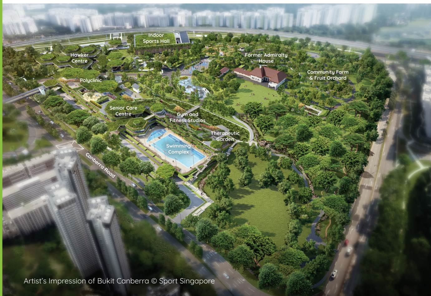
Artist's Impression of Bukit Canberra

Our towns are planned to be liveable and self-sufficient, with easily accessible shops, health care, schools, community facilities and parks. Commercial nodes, industrial estates and business parks within or nearby the town, also help to provide nearer job opportunities for residents. The detailed planning and implementation of plans for each town is a joint effort of many government agencies.