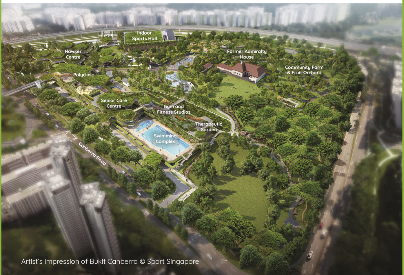
Artist's Impression of Bukit Canberra

Bandar-bandar kita dirancang agar lengkap dan sesuai untuk didiami, dengan kemudahan kedai, pusat kesihatan, sekolah, prasarana masyarakat dan taman. Pusat-pusat komersial, estet-estet perindustrian dan taman-taman perniagaan di dalam lingkungan atau berhampiran kawasan bandar juga menyediakan peluang pekerjaan untuk penduduk setempat. Perancangan terperinci dan pelaksanaan pelan untuk setiap bandar merupakan satu usaha bersama pelbagai agensi pemerintah.