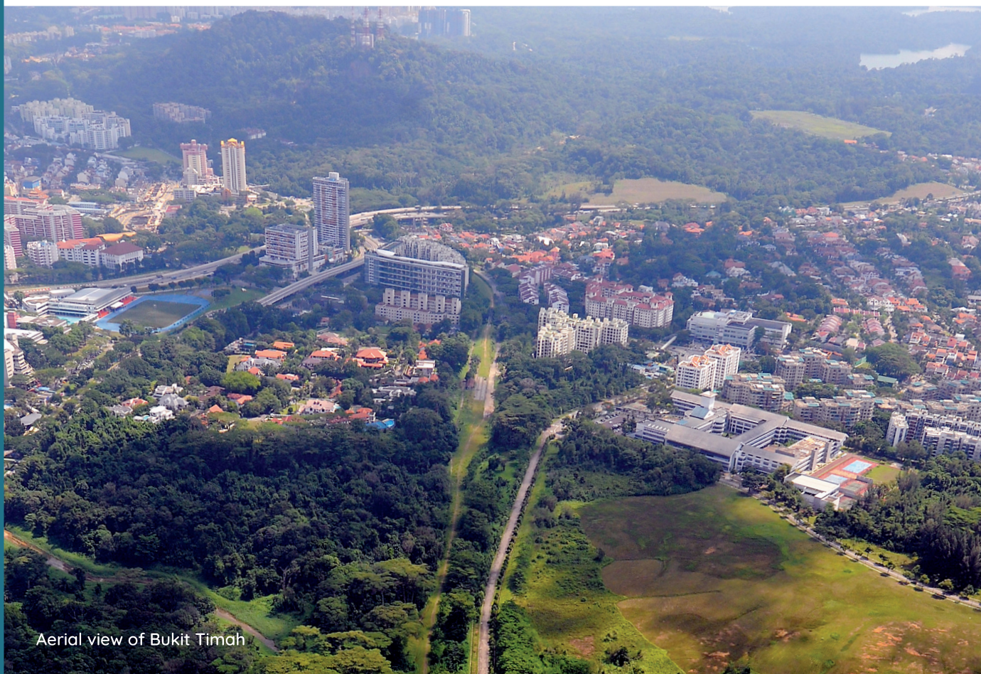
Aerial view of Bukit Timah

Bandar-bandar kita dirancang agar lengkap dan sesuai untuk didiami, dengan kemudahan kedai, pusat kesihatan, sekolah, prasarana masyarakat dan taman. Pusat-pusat komersial, estet-estet perindustrian dan taman-taman perniagaan di dalam lingkungan atau berhampiran kawasan bandar juga menyediakan peluang pekerjaan untuk penduduk setempat. Perancangan terperinci dan pelaksanaan pelan untuk setiap bandar merupakan satu usaha bersama pelbagai agensi pemerintah.