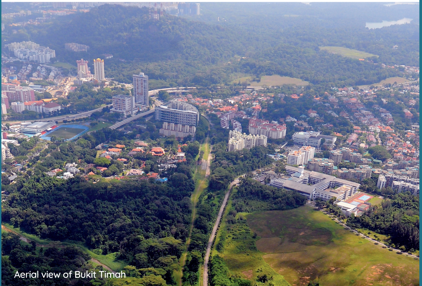
Aerial view of Bukit Timah

我们的规划确保每个市镇有宜居的居住环境并且自给自足，无论商店、医疗设施、学校、社区设施和公园都由有效的交通网络联系起来使居民可以方便使用。此外，市镇内或其周边的商业中心、工业区和商业园也能为居民提供就近就业机会。每个市镇的详细规划与规划的落实都是多个政府机构共同努力的成果。