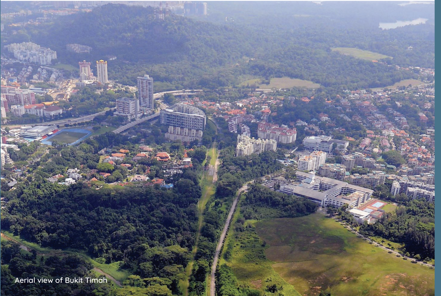
Aerial view of Bukit Timah

நமது நகரங்கள், வாழத் தகுந்த வகையில், எளிதில் சென்றடையக்கூடிய கடைகள், சுகாதாரப் பராமரிப்பு சேவைகள், பள்ளிகள், சமூக வசதிகள், பூங்காக்கள் ஆகியவற்றுடன் கூடிய போதுமானத் தன்மையுடன் இருக்கும் வகையில் திட்டமிடப்படுகின்றன. நகரத்திற்குள் அல்லது நகரத்திற்கு அருகே அமைக்கப்பெறும் வர்த்தக முனைகள், தொழில்துறைப் பேட்டைகள் மற்றும் வர்த்தகப் பேட்டைகள், குடியிருப்பாளர்களுக்கு மிக அருகாமையிலேயே வேலை வாய்ப்புகளை அளிக்கத் துணை புரிகின்றன. ஒவ்வொரு நகரத்திற்கான விரிவான திட்டமைப்பும் அவற்றின் செயலாக்கமும், பல அரசாங்க அமைப்புகளின் கூட்டு முயற்சியாகும்.